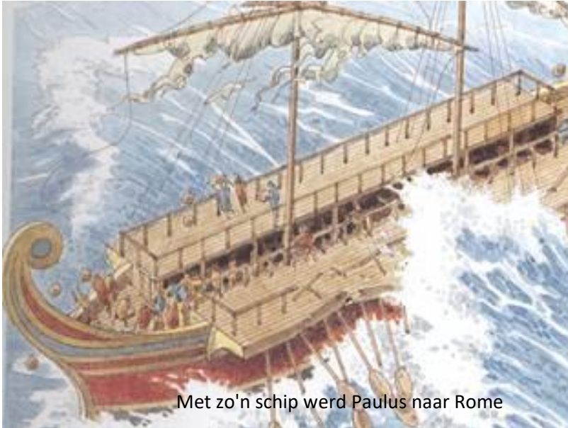
Met zo'n schip werd Paulus naar Rome

In onze tijd maakt het voor de zeevaart helemaal niets uit of het nu winter is of zomer. De schepen varen wel. Dat was zeker niet het geval in de tijd van Paulus. Het was veel te riskant om in de winter te varen.