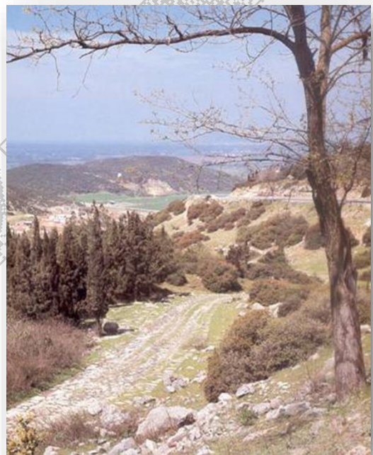
De beroemde Via Appia, Romeinse heerweg die uitkwam in Rome.

Voorals keizer Augustus heeft vele nieuwe wegen in het Romeinse rijk aangelegd.